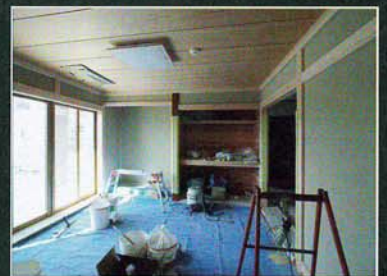
見ごたえある和室(写真は完成前)