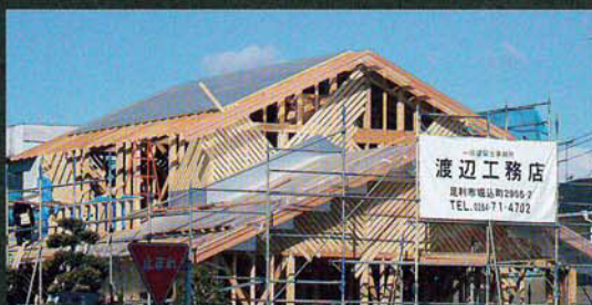
渡辺工務店 足利市堀込町2955-2 TEL. 0284-71-4702

耐力壁はスジカイと金物で充分ですが、なおかつ建物全体に幅90ミリ、厚さ15ミリの桧の板を釘で斜めに一枚一枚しっかり固定することで建築基準法の3倍以上にもなり、さらに、耐力壁内では床から屋根裏まで空気の換気(二重通気)が行なわれますので、壁内での結露はありません。