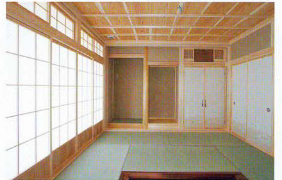
本格的な和室は、桧4寸角の柱に左官真壁珪藻土仕上げと伝統の竿縁天井で仕上げ、家族全員が囲める大きな炬燵を造りました