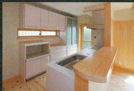
右は対面式のキッチン