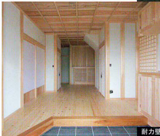
全館を左官真壁珪藻土仕上げ、玄関の天井も竿縁天井で仕上げて木との調和を演出

このたびの東日本大震災で被害を受けました方々に、心からお見舞い申し上げます。渡辺工務店が東日本大震災の前にすでに実施した見学会は 105 回の実績がありますが、見学会を実施された新築建物の被害は全くありませんでした。じっくりご見学ください。なお、一級建築士の棟梁がご案内と説明を致しますので、毎回好評の見学会です。是非ご覧下さい!