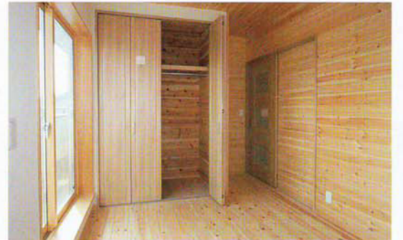
子供部屋も、松の無垢板と珪藻土で仕上げました 渡辺工務店の標準的な家造りにアキレス外張り断熱・北海道仕様熱損失係数「Q値 = 1.60W/m 2 K」、換気・第1種熱交換を使用しています。 集成材、ベニヤ板、ビニールクロスは一切使用しておりません。