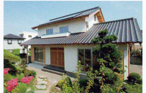
街中にありながら落ち着いたたたずまいの本格和風造りの住宅です。屋根は三州瓦で、太陽光発電を設置して災害に備えます。サッシは断熱効果の高い Low-Eアルゴンガス入りを使用しています