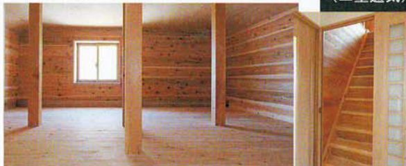
有効活用の屋根裏部屋と3階への階段