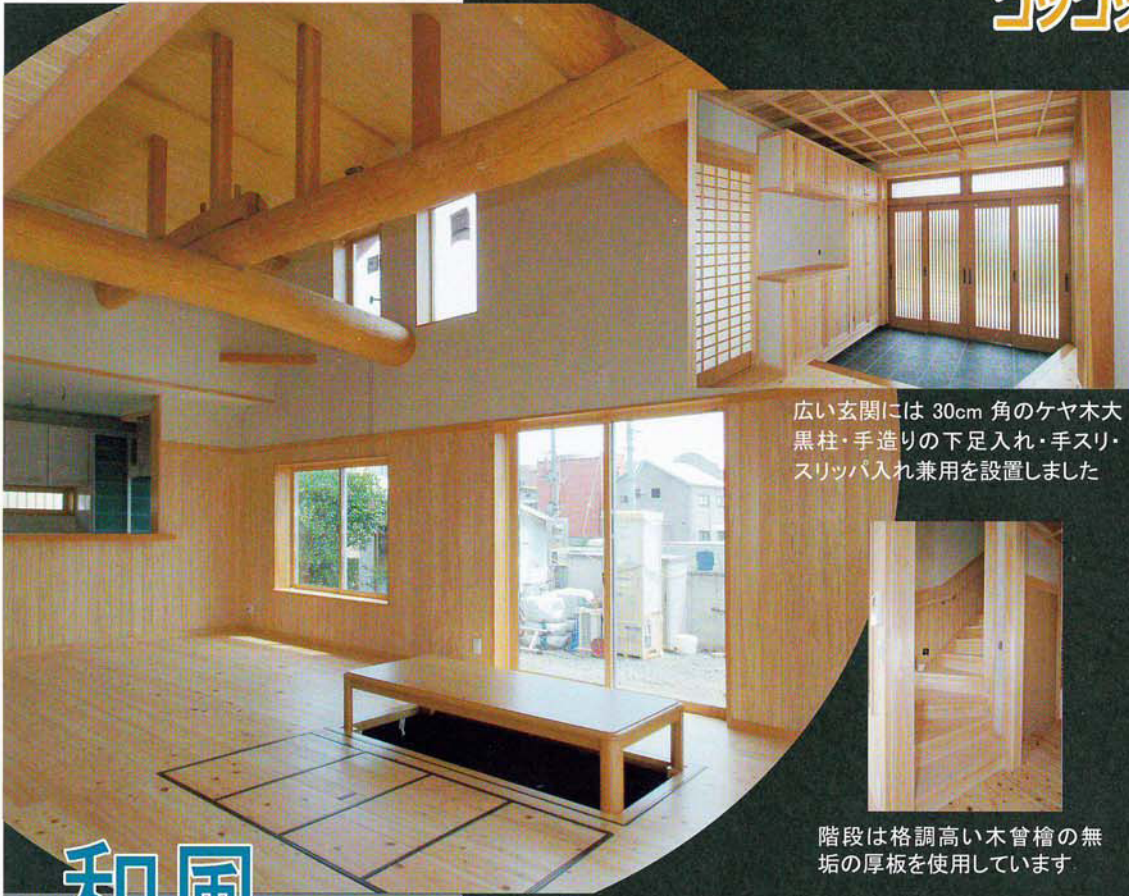
広い玄関には 30cm 角のケヤ木大黒柱・手造りの下足入れ・手スリ・スリッパ入れ兼用を設置しました