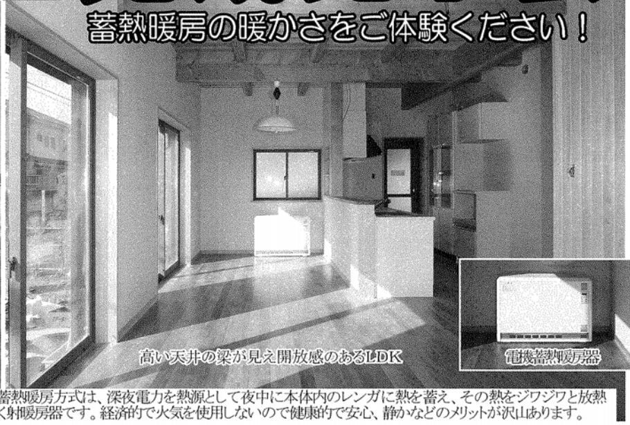
◎蓄熱暖房とは・・・Y様邸の蓄熱暖房方式は、深夜電力を熱源として夜中に本体内のレンガに熱を蓄え、その熱をジワジワと放熱し、1日中暖房が出来る快適ふく射暖房器です。経済的で火気を使用しないので健康的で安心、静かななどのメリットが沢山あります。