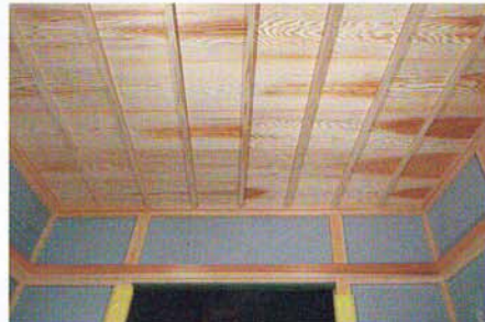
伝統の「さお縁稲子天井」の和室

ヒノキ構造材での耐震性 無垢の国産材で安心 外張り断熱の省エネ効果が高い 地元の匠が質の高い家を丁寧にコツコツと仕上げました。