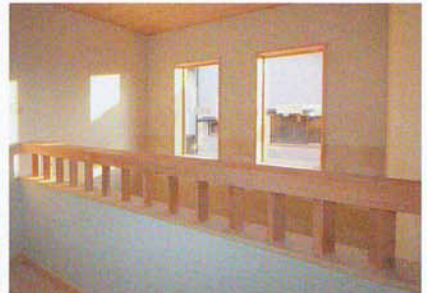
2Fケヤキ無垢の手摺り