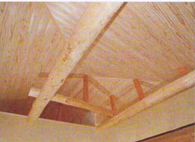
丸太の見える天上