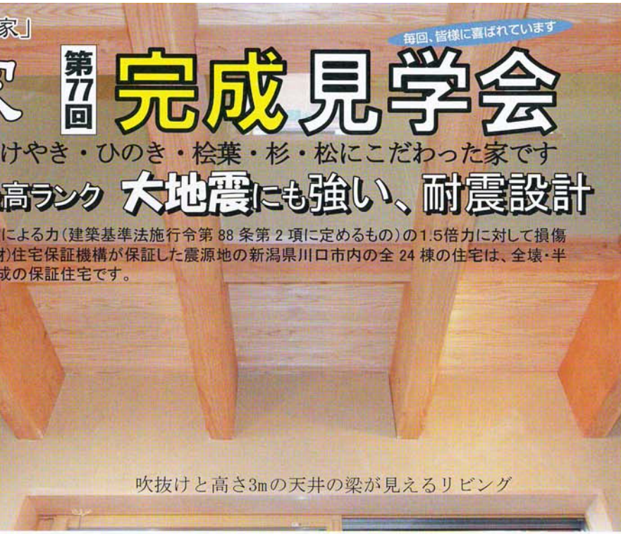
吹抜けと高さ3mの天井の梁が見えるリビング