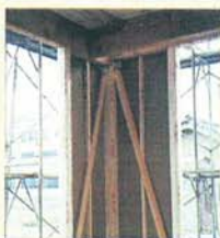
通常の2.5倍の耐震性。スジカイ+ダイライト貼り