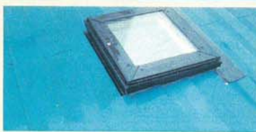
さびない・腐らない・ステンレス材/天窗