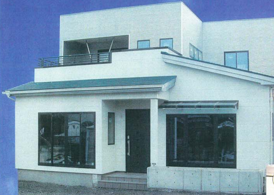
※写真は建設中のものです。