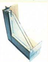
外側/アルミ、内側/樹脂、LOW-Eペアガラス