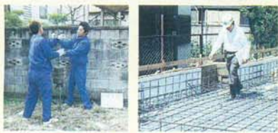
地盤調査風景 基礎検査風景