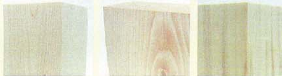
(柱)…檜・乾燥材4寸角 (梁)…まつ (土台)…ヒバ 白アリ等害虫に強い